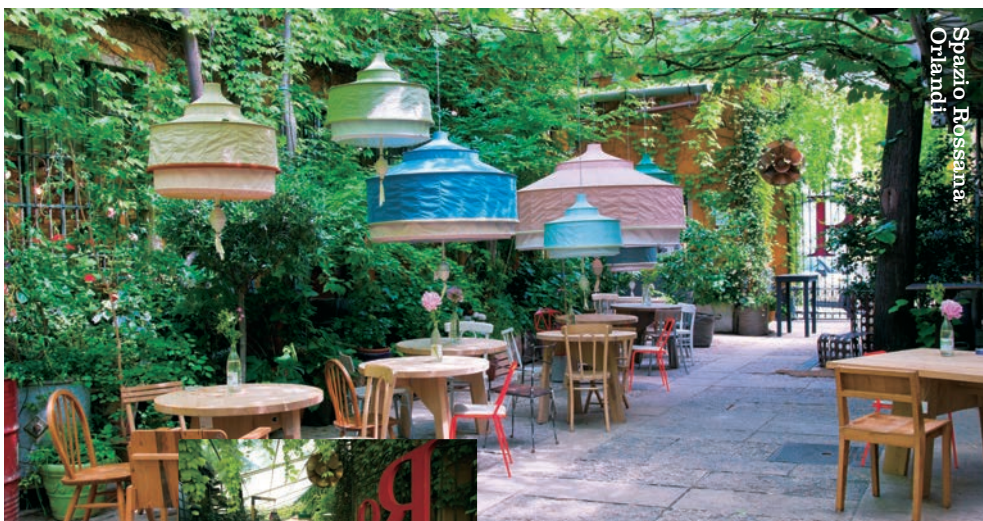
Spazio Rossana Orlandi