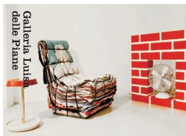
Galleria Luisa delle Piane