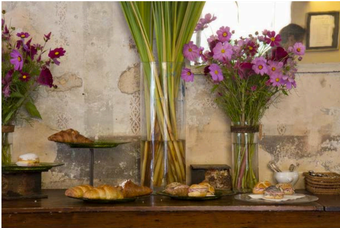
Fioraio Bianchi Caffè

Essenza che negli anni ha mescolato il profumo dei fiori all'aroma del caffè del mattino quando si va da 'Fioraio' a fare colazione con brioche calde e chiacchiere, ma anche ai sapori buoni di una cucina che basa il proprio menù sulla stagionalità e che propone piatti pensati per tutti, dalla carne al pesce, dalle verdure ai primi.