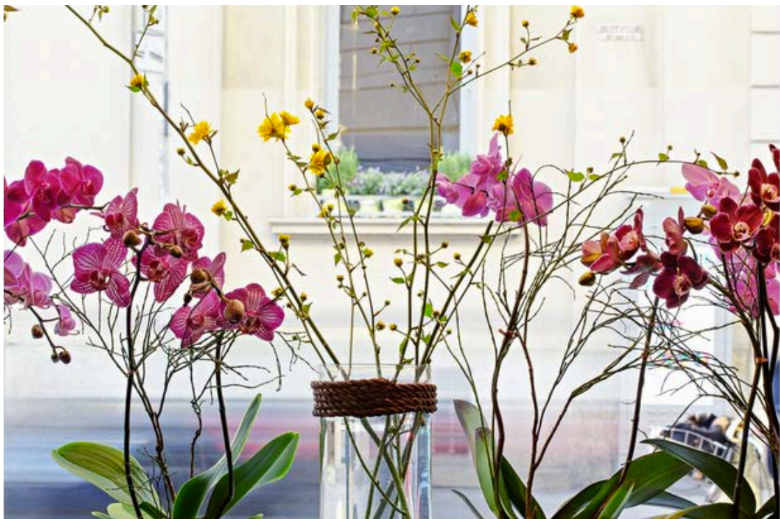
Fioraio Bianchi Caffè – Crediti: Raffaella Braghini

Impazzano su Pinterest e su altri social media 'fotografici', album interamente dedicati alla magia di Parigi e delle parisienne con gonne a ruota e ballerine, fasci di tulipani tra le braccia e caschetti alla garçonne appena scompigliati dal vento, oppure intente a mantenere la loro figurina sottile mangiando burrosi croissant e bevendo (italianissimi) cappuccini spolverati di cacao. E alzate la mano chi, ragazze che leggete, almeno una volta scorrendo queste gallerie non abbia desiderato essere lì, all'ombra della Tour Eiffel, come nel migliore dei luoghi comuni, a sorseggiare café au lait con aplomb perfetto e nasino all'insù.