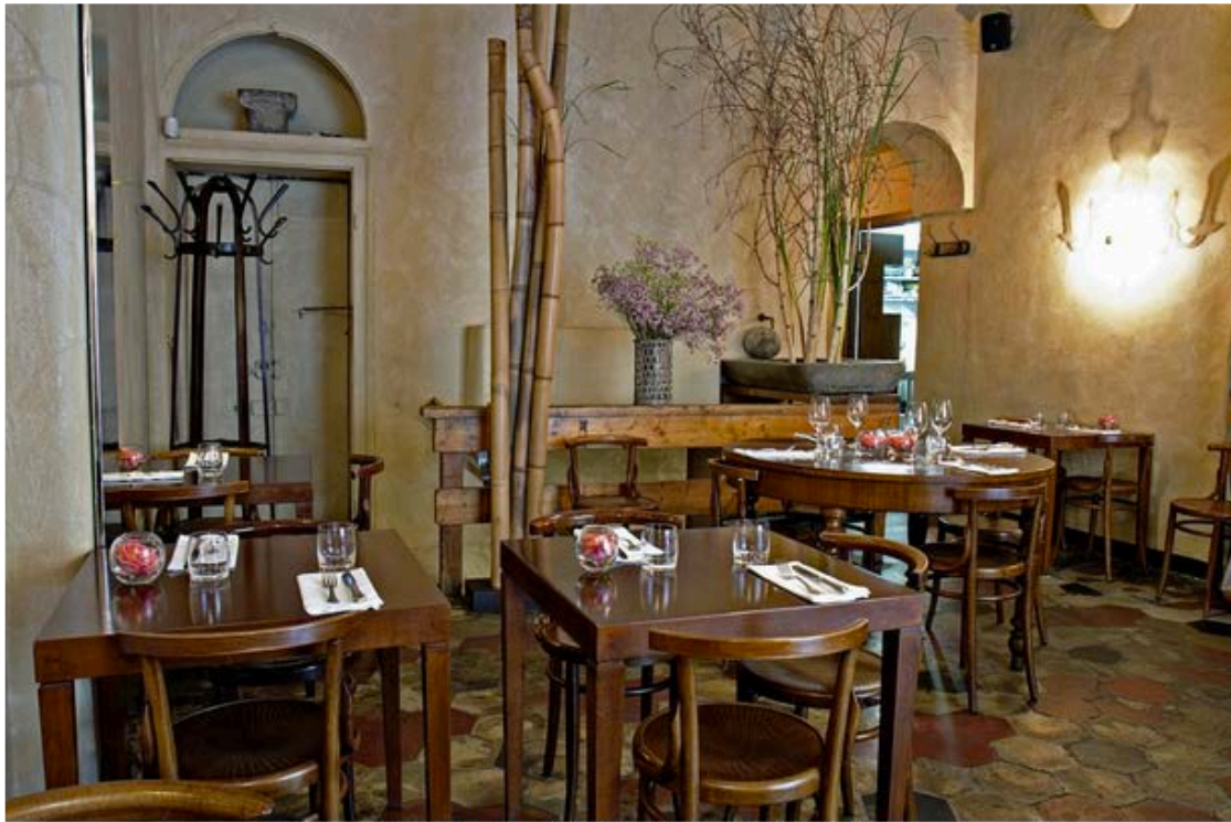
Fioraio Bianchi Caffè

E invece magari abitate a Milano, al mattino prendete spintoni uscendo accaldate dalla metropolitana, cercate invano di accaparrarvi l'ultima brioche (o cornetto se siete a Roma e dintorni) ripieno di marmellata al bar e arrivate in ufficio trafelate con la piega fatta con la piastra resa vana dall'umidità.