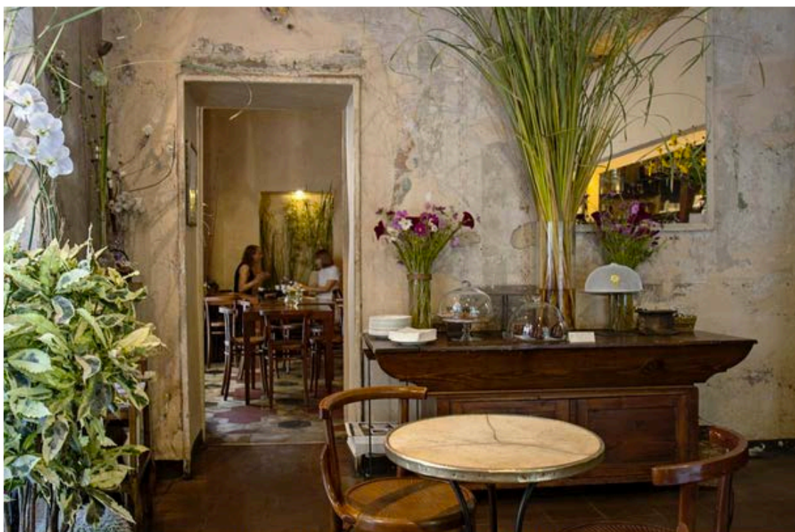
Fioraio Bianchi Caffè – Credits: Raffaella Braghini

Beh sappiate che vi capiamo perfettamente e che, se siete a Milano, abbiamo trovato anche la soluzione per ritagliarvi quella mezz'ora di tempo necessaria per sentirvi sfiziosamente parigine, ma comodamente sedute tra i fiori di Fioraio Bianchi Caffè , famoso bistrò milanese dall'allure francese e dai sapori italiani che da più di quarant'anni vive nel cuore di Brera, cambiando negli anni e restando però sempre fedele alla sua vera essenza.