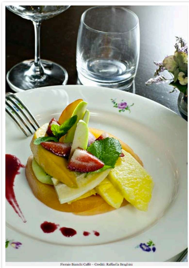
Fioraio Bianchi Caffè

L'aperitivo offre dei cocktail ottimi, ma è ancora più bello quando Milano diventa calda e chi esce dall'ufficio si allenta la cravatta e decide di radunarsi in gruppetti proprio fuori da Fioraio Bianchi, chiacchierando in attesa della cena.