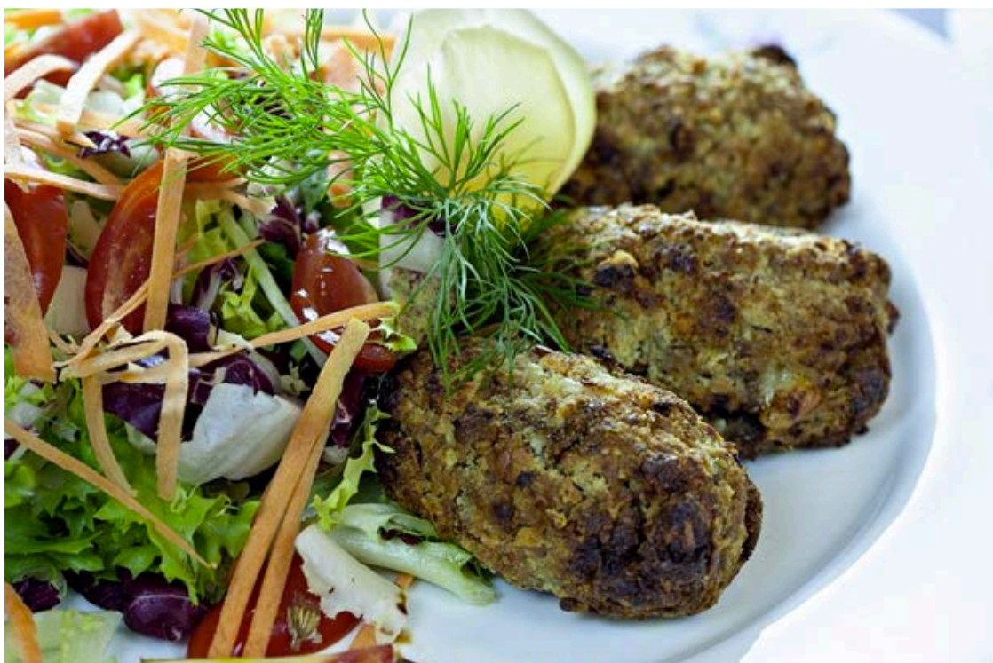
Fioraio Bianchi Caffè

Noi ci siamo stati l'ultima volta per una cena di fine estate facendoci tentare da una golosa burrata servita con crostini dorati e alicette, dai fiori di zuccina ripieni e dalle trofie saltate al pesto: sapori semplici ma robusti, serviti su piatti bianchi decorati da fiorellini, come quelli della nonna.